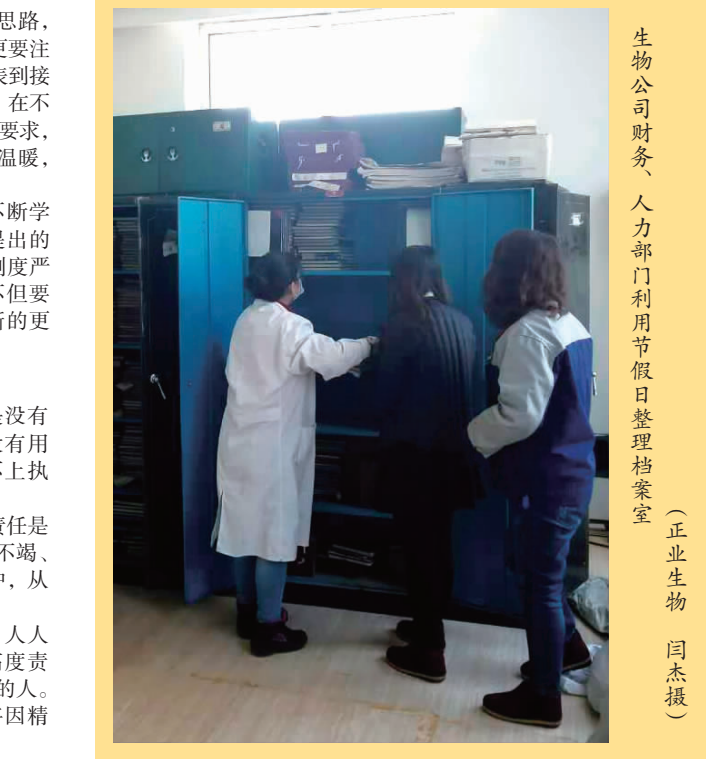
生物公司财务 人力资源部门利用节假日整理档案室

中，不仅要不断努力创新，拓宽思路，抓住一切机会进行招商，同时，更要注重自己的形象，从着装、仪容仪表到接待人待物都要诚恳谦逊、言词得当，在不违反原则的情况下尽量满足业户的要求，使业户感觉到商城员工的热情和温暖，愿意留下来与商城共渡难关。 因此，我们在工作中需要不断学习，不断提高，努力践行韩董提出的“责任、担当和创新”精神，用制度严格要求自己，约束自己，我们不但要守好业，更要为企业发展做出新的更大的贡献。