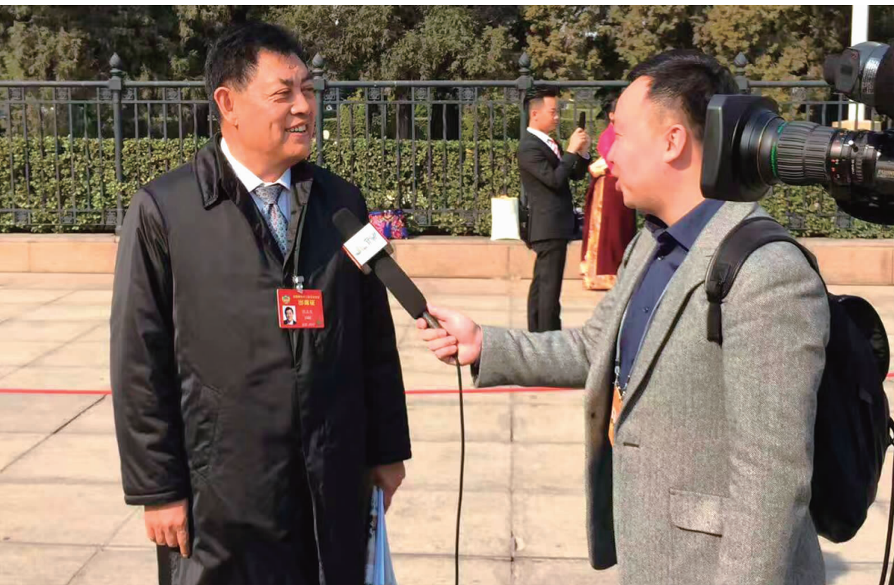
正业集团韩真发董事长于3月3日参加了全国政协十二届五次会议，聚焦改革领域突出问题，提出了关于财政扶持农业发展等方面的提案，为农业供给侧改革等国计民生问题进谏言、献良策。近日，《人民日报》、《吉林日报》、吉林电视台、《协商新报》等多家主流媒体报道了韩真发董事长的提案，《联合日报》、吉林广播网、长春新闻网等多家权威大型网站均予以转载，受到广泛关注。