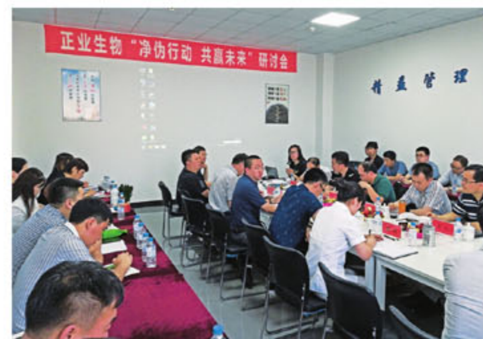
研讨会会议现场一