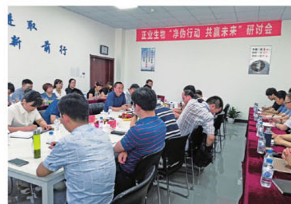
研讨会会议现场二