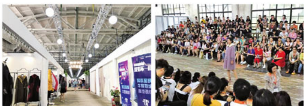
特别是华正批发的经营业户来说实属及时雨，第一时间掌握了服装市场在南方时尚前沿。