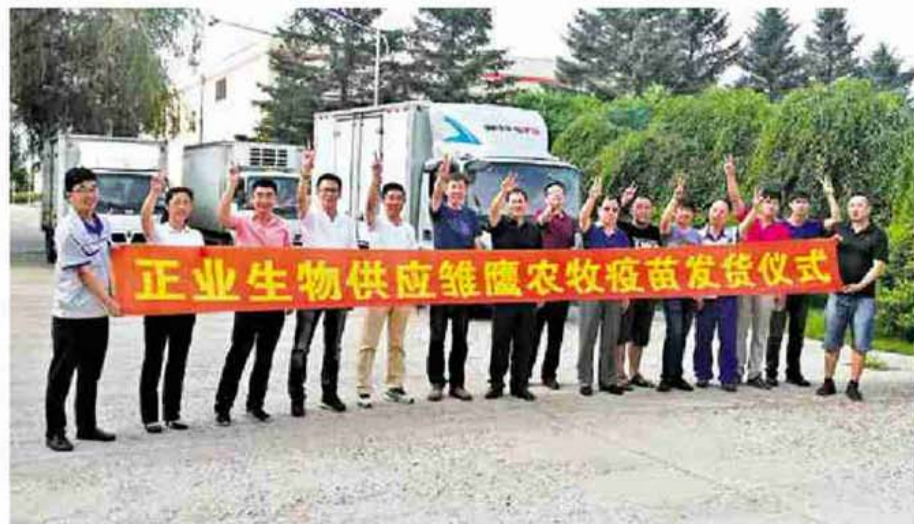
7月7日上午,装满猪支原体活疫苗、伪狂犬活疫苗等疫苗产品的冷藏车辆从生物公司出发,正式运往号称“中国养猪第一股”的雏鹰农牧集团。

会议进一步要求,临近中秋、国庆,旅游旺季即将到来,宾馆客流量将急剧增加,随之而来的消防安全事故风险也在显著增加,火灾易发、多发,要在节前做好“五个一”,即各部门进行一次专题汇报,分析面临的消防安全形势;节前召开一次消防安全工作会议,指出存在的突出问题;部署开展一次专项检查评估,对发现问题责令立即整改;组织开展一次全员消防安全培训和疏散演练;开展一次集中宣传,推广经验做法、曝光问题隐患。