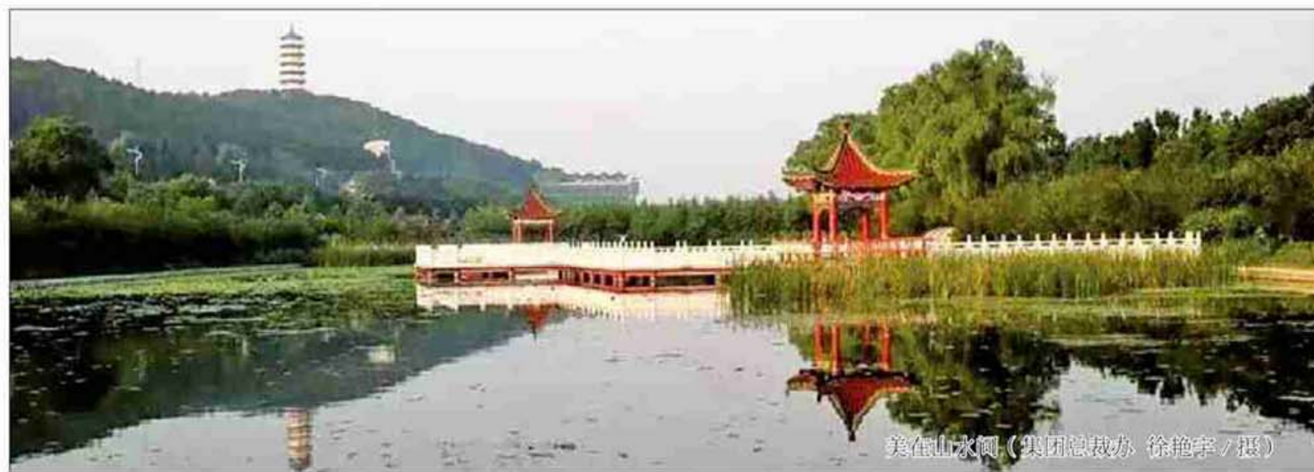
梅山水阁