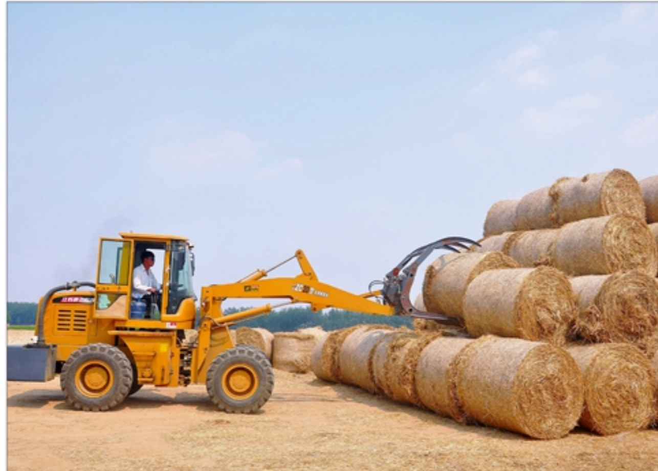
江苏省东海县采取“国家补贴一点、地方政府补贴一点、农机专业合作社自筹一点”的办法,鼓励农机专业合作社和社员购买打捆机。社员们及时将散落各地的废弃秸秆整理打包,集中销售到生物质发电厂、奶牛养殖场等地。这样,不仅杜绝了秸秆焚烧,还增加了社员们的经济收入。图为社员正在将打捆的麦秸码垛。